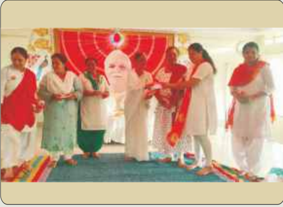
आदिपुर : आंतरराष्ट्रीय योग दिवसानिमित्त कार्यक्रमात योग शिक्षकांना ईश्वरी भेटवस्तू देताना ब्र.कु. भारती